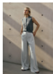
Title Agatha 27491 | 9002 | 913