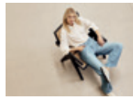
24 Sventy B 20264 | 9438 | 820