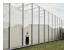
08 Mayla 6/8 206668 | 6824 | 890