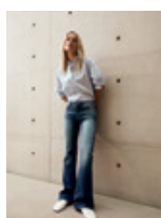
16 Nella 5080 | 9373 | 847