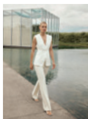
02 | 03 Doro Flared 25361 | 9623 | 320