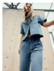
Back Cover Giuliette (Shirt) 1606 | 9372 | 840 Anjella 5079 | 9372 | 840