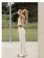
09 Sventy Belt 20265 | 6627 | 325