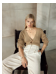
12 | 13 Mayla 2066 | 6916 | 12