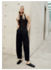
27 Tavia 7/8 507578 | 6909 | 990