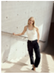
22 | 23 Flora 7/8 508778 | 9903 | 990