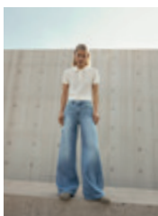
36 | 37 Sena 20267 | 9438 | 820