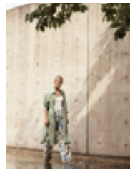
35 Albena 28213 | 6369 | 71