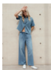
17 Giuliette (Shirt) 1606 | 9372 | 840