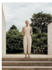
05 Hanni 505317 | 9374 | 207