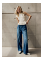
20 | 21 Mayla 2066 | 9438 | 850