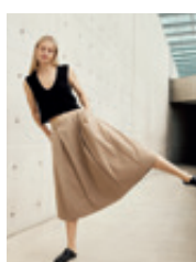
10 | 11 Vivian 4141 | 6910 | 614