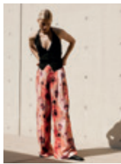
30 | 31 Dominique 2533 | 9136 | 57