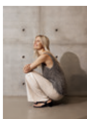
18 | 19 Agatha 27491 | 6364 | 921