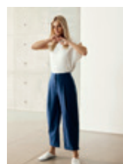
15 Lisan 6/8 508168 | 6262 | 873