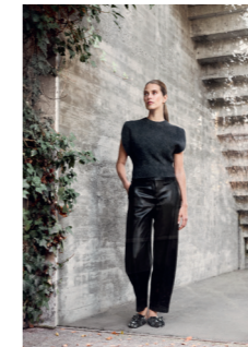
Phibi 537978 6990 990