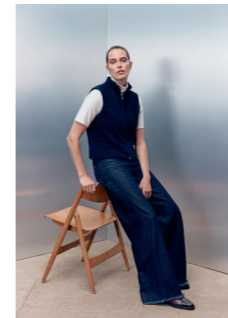
Sena 20267 9396 890