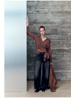
Sventy Turn Up 202622 9382 980