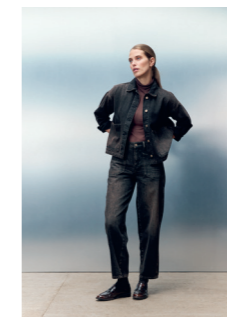
Avelin 1619 9382 680 Arin 53151 9382 680