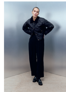
Loraya 6/8 537068 6951 990