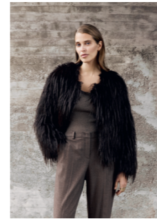
Milara 5337 6110 68