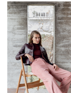
Myri 5388 6954 518