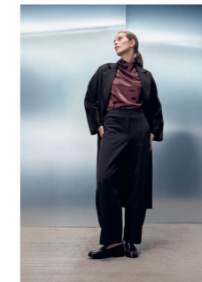
Hale 7/8 24462 9947 680