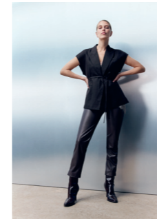
Ronija 539278 6736 680