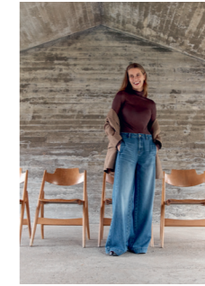
Jaluna 5375 9382 846