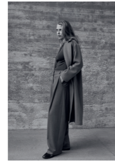
Fraya 5376 3032 62