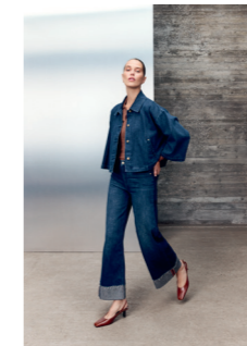
Soreia 1620 9394 885 Sventy Turn Up 202622 9394 885