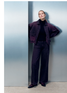
Avelin 1619 9382 585 Sventy 2026 9382 585