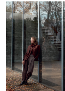
Tavia 7/8 507571 6953 61