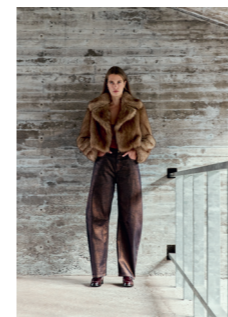
Tira 5372 6218 896